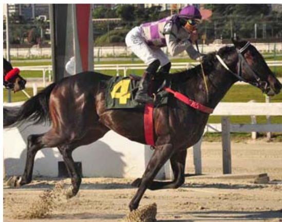
JOKENPO - GP Adil - G3

Lote 01, JOKEMASTER , filho de Yagli em Joking Aside , por Midnight Tiger . Cavalo com 1 vitória e 9 colocações (4 placés), em 13 saídas. Vem de 2* em 30.10 e 2* em 05.10. Irmão do ganhador clássica JOKENPO (GP Pres. do Jockey Vlub - GIII). Linha feminina de ACREDITADO [GIII], JOLLY MELODY [GII].