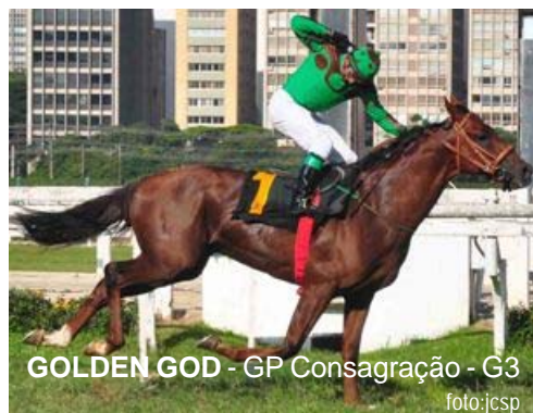
GOLDEN GOD - GP Consagração - G3