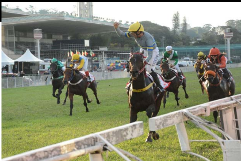
PATEO DO BATEL, criação de ROBERTO BELINA vence o OSAF 2017 em SP