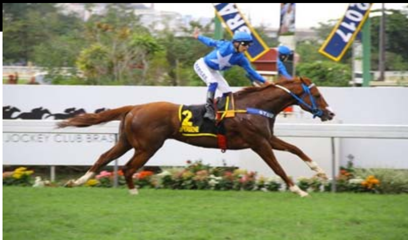
PERBENE, filho de TIGER HEART, é o Rei da Velocidade Nacional